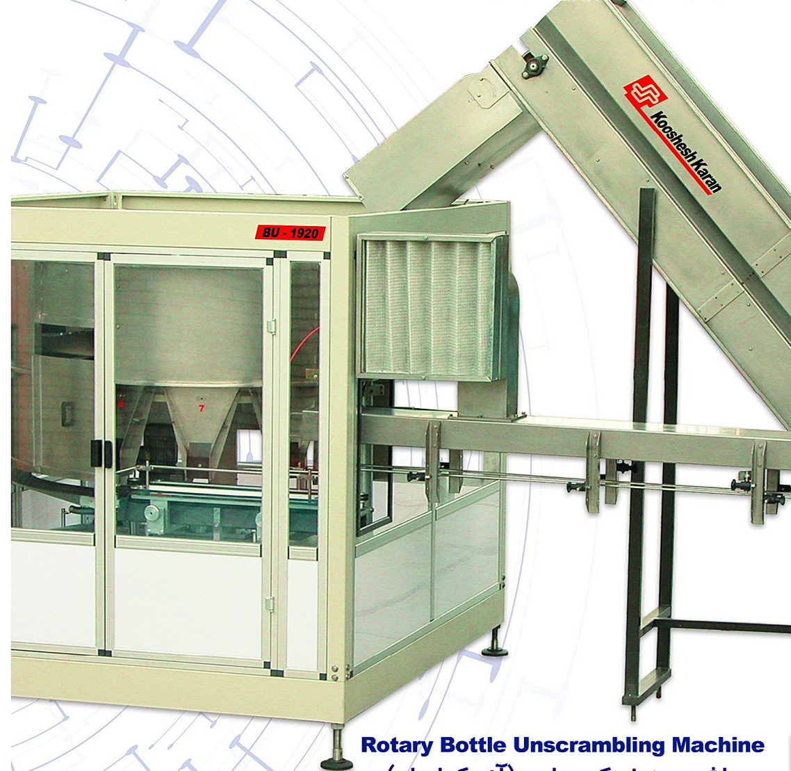
Rotary Bottle Unscrambling Machine ماشین ردیف کن بطری (آنسکر امبلر)