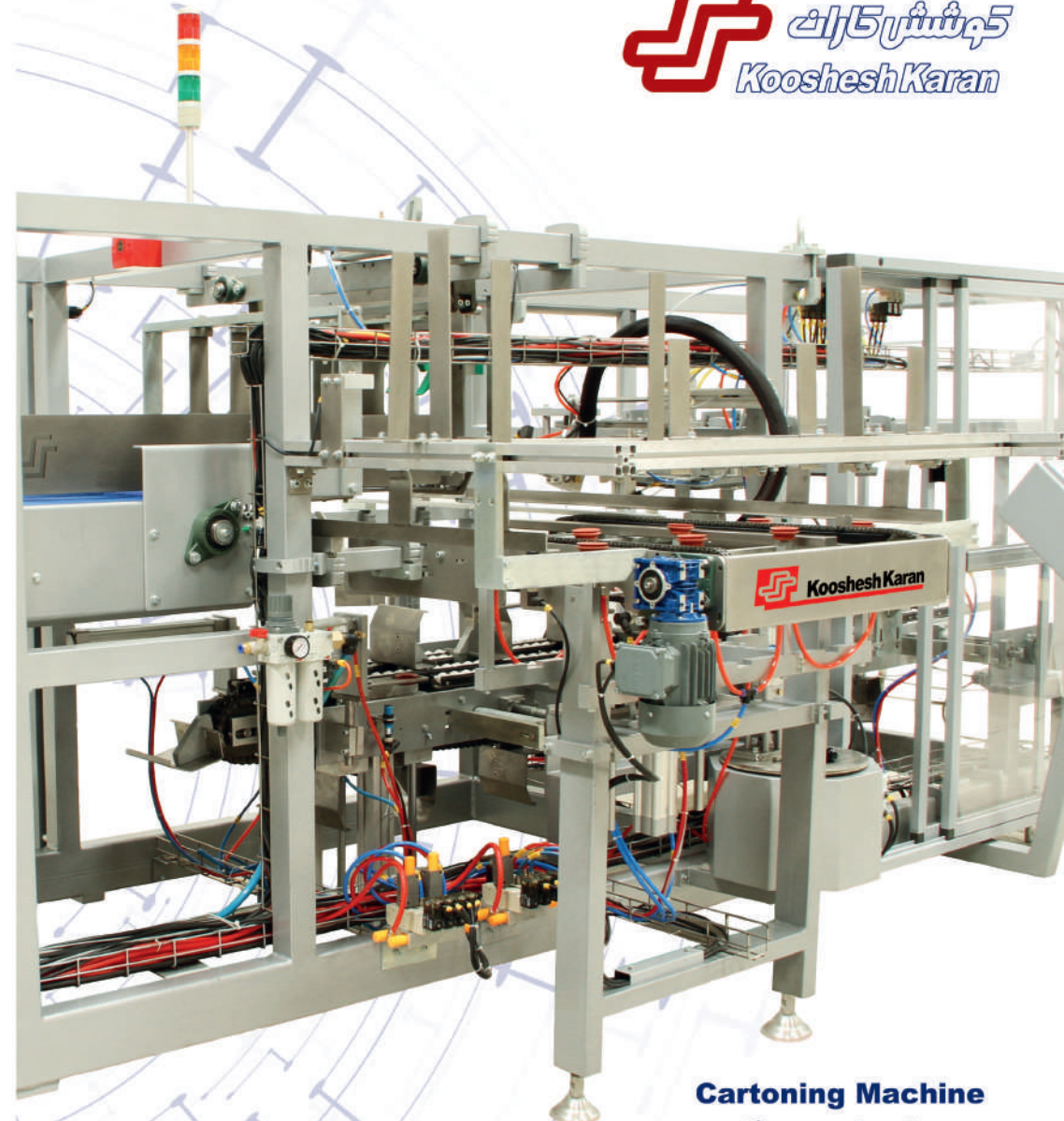
Cartoning Machine ماشین کارتونینگ CA 15