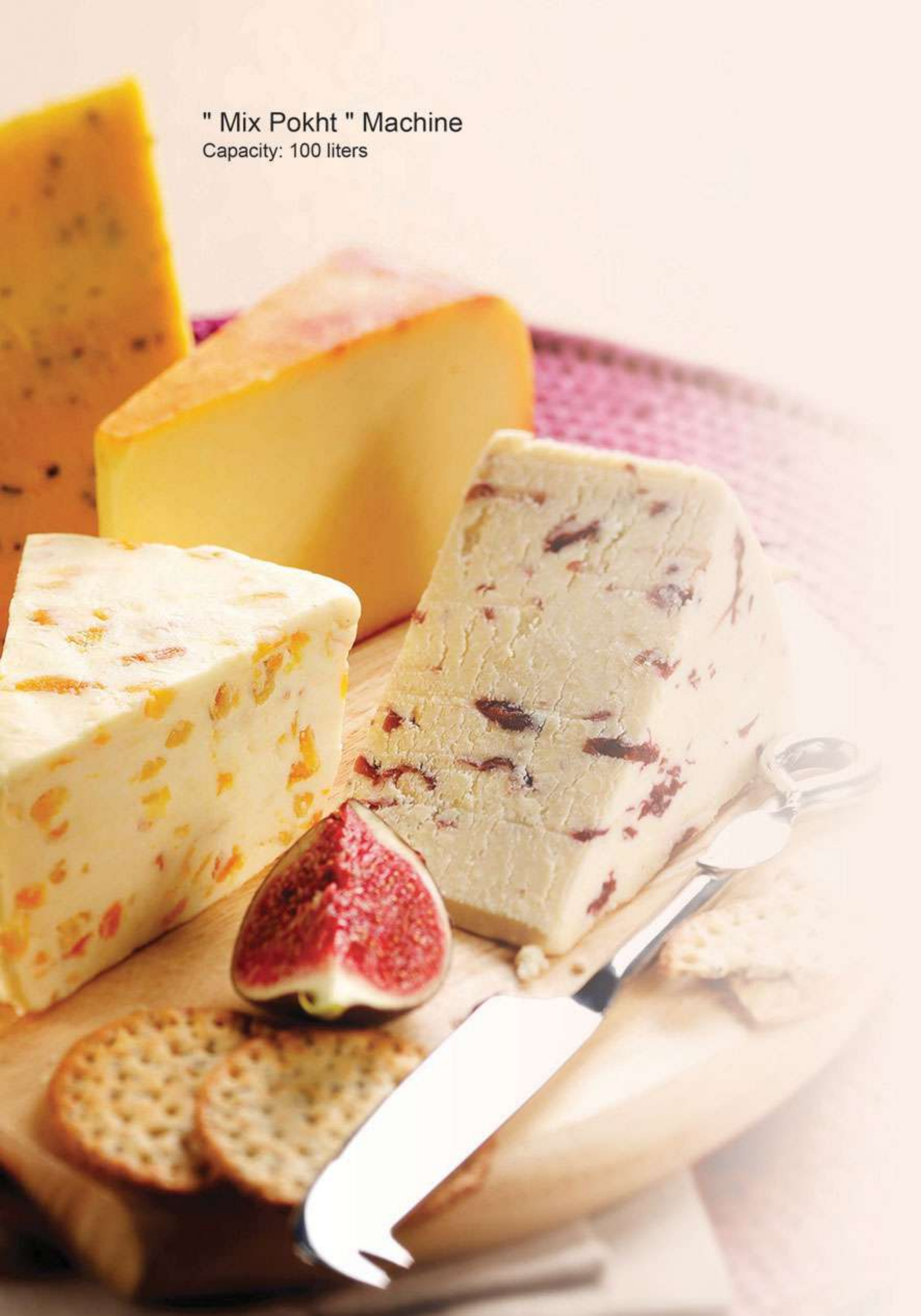
" Mix Pokht " Machine Capacity: 100 liters